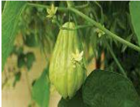
Gambar 1. Tanaman Labu Siam

Syarat dalam pembuatan selai yaitu harus mengandung pektin [5]. Selai labu siam merupakan pangan semi basah yang sudah dikenal serta disukai oleh masyarakat. Pemanfaatan labu siam menjadi produk selai sangat menguntungkan. Produk selai ini dapat disimpan dalam waktu yang relatif lama [6]. Adapun tujuan dari kegiatan penyuluhan yang diadakan di Balai RW 04 Medayu Selatan Kosagrha adalah dapat memberi ilmu pengetahuan dalam pembuatan selai sebagai bahan makanan yang mempunyai nilai jual dan juga dapat di produksi sendiri dirumah.