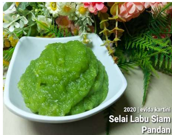
Gambar 5. Selai Labu Siam Pandan