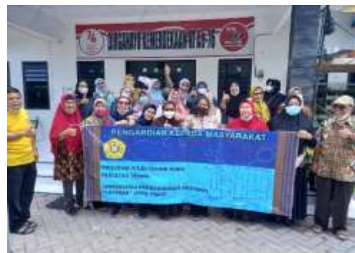
Gambar 4. Penyuluhan Abdimas