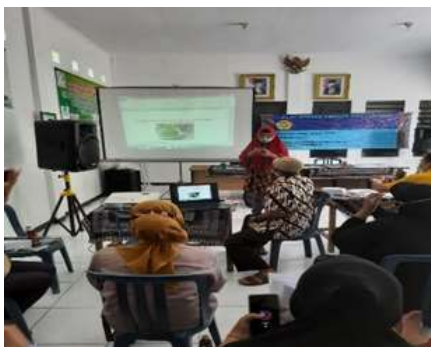
Gambar 3. Presentasi Materi

Pengabdian masyarakat dengan penyuluhan dilakukan bersama kelompok PKK di Balai RW 04 Medayu Selatan Kosagrha. Pada penyuluhan ini dengan mempresentasikan cara-cara pembuatan selai labu siam pandan sampai dengan pembuatan packagingnya. Adapun bahan yang digunakan dalam pembuatan selai labu siam pandan adalah sebagai berikut: Labu siam 200 gram, gula pasir 150 gram, pandan wangi 10 lembar, vanili bubuk 2 sachet, garam secukupnya, mentega secukupnya, perasan jeruk nipis sesuai selera, dan air 150 ml. Cara pembuatan selai labu siam pandan: pertama diblender daun pandan wangi kemudian disaring dan sisihkan. Labu siam dikukus lebih dahulu, setelah dingin diblender hingga halus. Campurkan mentega, garam, gula pasir, dan labu siam yang sudah dihaluskan. Ditambahkan 100 ml perasan pandan wangi, vanili, perasan jeruk nipis, kemudian dimasak sampai labu siam mengental, dan diangkat lalu didinginkan. Kemudian selai labu siam pandan siap untuk dikemas ditempatkan dalam tempat kemasan.