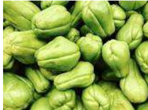
Gambar 2. Buah Labu Siam